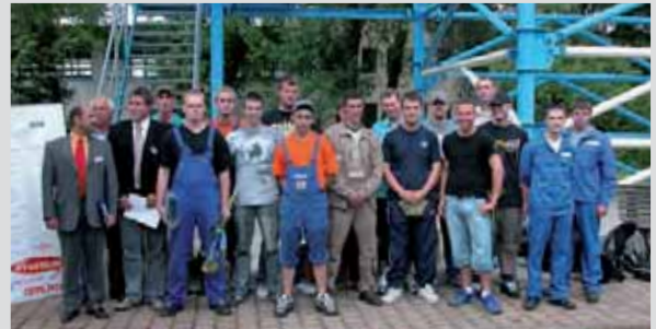
Teilnehmer am Landeswettbewerb „Jugend schweißt“ des DVS-Landesverbandes Sachsen-Anhalt 2007

Weitere Aktionen sind bereits in Planung.